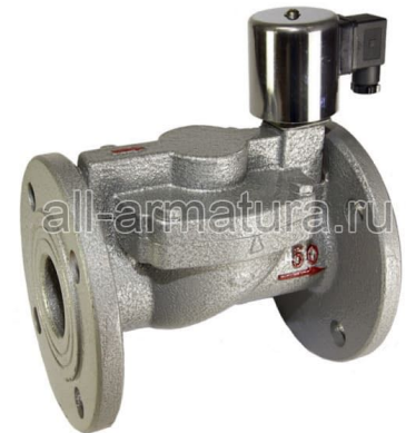
Клапан электромагнитный LV610