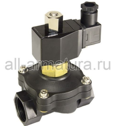
Клапан электромагнитный LV125